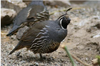
Boven: Chinese dwergkwartel Onder: Californische kuifkwartel

Dwergsoorten, zoals de Chinese dwergkwartel, de Japanse dwergkwartel en de harlekijnkwartel worden 11 tot 15 cm groot. De Virginische boomkwartel en de Californische kuifkwartel worden 22 tot 25 cm groot. Sommige soorten worden ook op kleur gekweekt en komen in verschillende variëteiten voor.