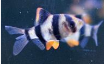
De sumatraan, een bekende soort.

De kegelvlekbarbeel ( Trigonostigma heteromorpha ) en de sherrybarbeel ( Puntius titteya ) zijn twee redelijk gemakkelijk te houden soorten voor in een gezelschapsaquarium. Deze soorten hebben een temperatuur van 23 tot 26 °C nodig en lichtjes zuur, niet te hard water. De vijfstreepbarbeel ( Puntius pentazona ) houdt van zuurder water, en is daarom meer geschikt voor een speciaal aquarium. Deze soorten worden allemaal 4 à 5 cm groot en kan je in een aquarium houden van 60 cm x 30 cm x 30 cm (lengte x breedte x hoogte) of groter.