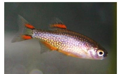
De hemelse pareldanio, Celestichthys margaritatus

Rasbora -soorten zijn vredelievend en meestal klein, zo'n 1,5 tot 5 cm. Ze komen in Azië voor in stilstaand water en verkiezen dichte beplanting en niet te felle belichting. Drijfplanten zijn aan te raden om het licht te dempen. Dwerg-rasbora's ( Boraras maculata ) behoren tot de kleinste soorten en worden slechts 2,5 cm lang. Ze komen het best tot hun recht in een speciaal aquarium met een pH van 6 tot 6,5. Een vrij recente ontdekking is de 'hemelse pareldanio', eerst Microrasbora galaxy genoemd maar tegenwoordig gekend onder de naam Celestichthys margaritatus .